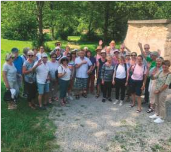
Bei unseren Walkern sind Neueinsteiger jederzeit herzlich willkommen.