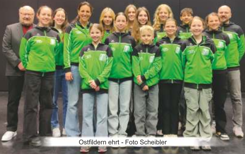
Ostfildern ehrt