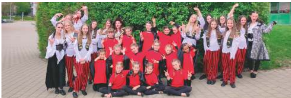
Black Beauties und Flaming Stars beim Ulmer Dance Cup (Mai 2023)

*Die Kinder der Minis und Maxis können sich eine Trainingszeit pro Woche aussuchen.