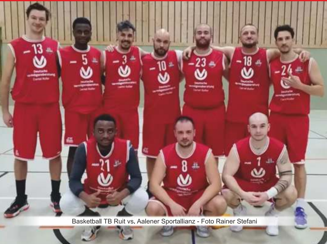
Basketball TB Ruit vs. Aalener Sportallianz