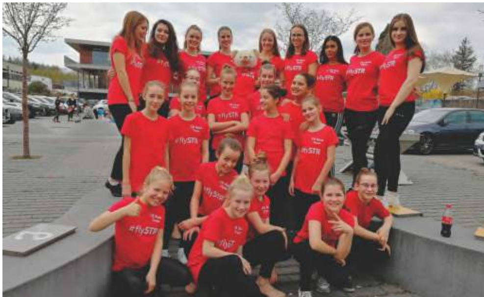
Black Beauties und Flaming Stars beim Schwaben Cup in Neuhausen.

*die Kinder der Minis und Maxi Kids dürfen nur einen der beiden Termine (Mi oder Fr) besuchen