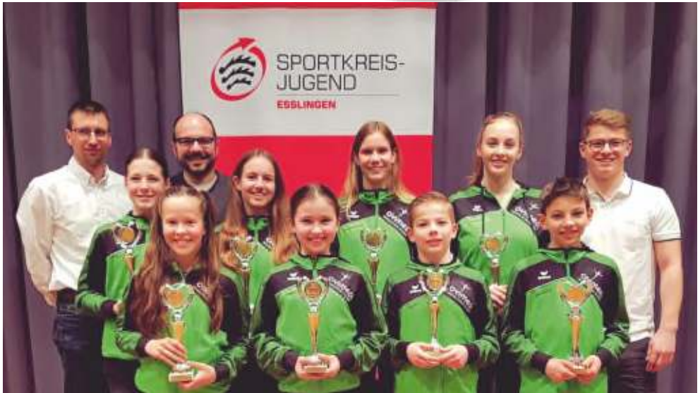
Trampoliner des TB Ruit bei der Sportkreisehrung Esslingen