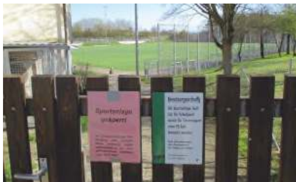
Corona Sperrung Sportanlage

Geschlossene Sporthallen, gesperrte Sportplätze – das war 2020 über Monate hinweg der traurige Ausblick für alle, die gerne Sport im TB Ruit treiben wollten. Mitte März hatte sich in Baden-Württemberg die Ausbreitung des Corona-Virus derart beschleunigt, dass sich der Übungs- und Spielbetrieb nicht mehr verantworten ließ und auch von staatlicher Seite nicht mehr zugelassen wurde.